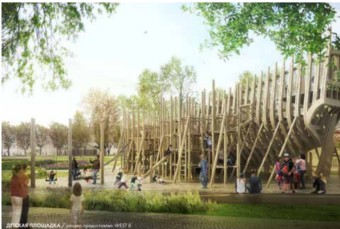
ДЕТСКАЯ ПЛОЩАДКА