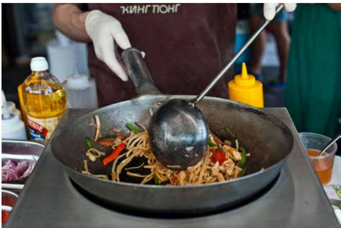
Кинг-Понг, Фотограф Егор Роголев, 2013