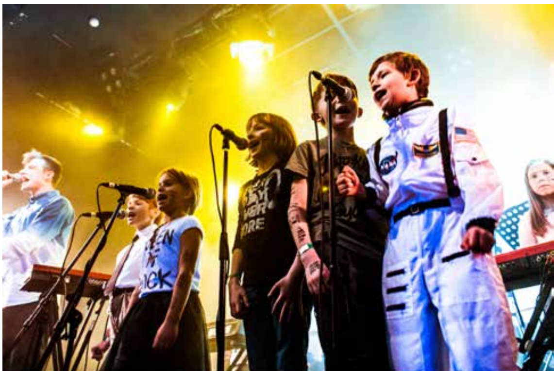
Концерт СБПЧ с детским хором. Фотограф Женя Анисимова, 2015