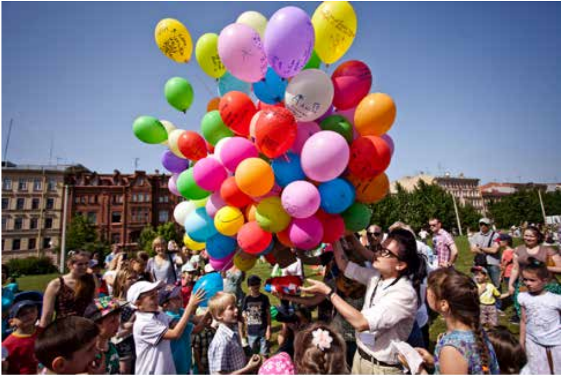
День бесполезных знаний.