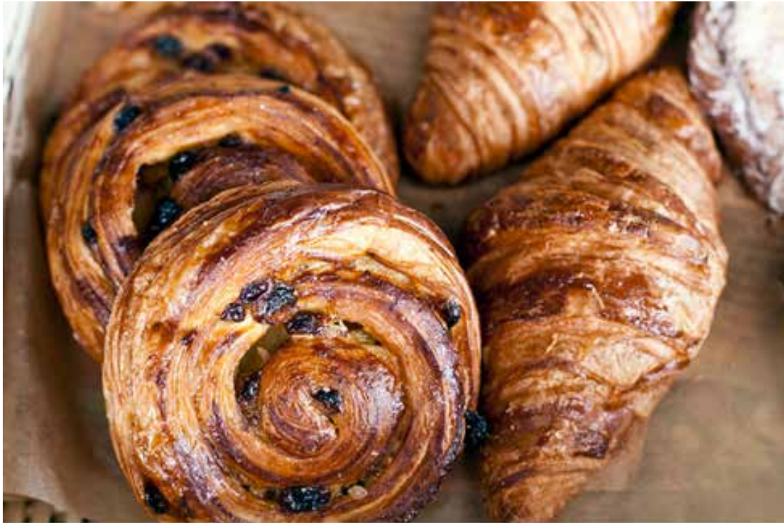
Волконский, Фотограф Егор Роголев, 2013