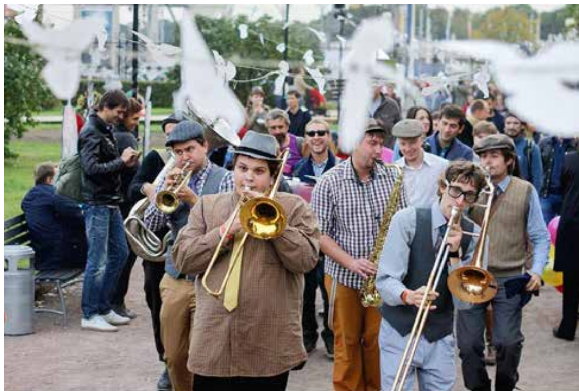
Мосбрас на фестивале SEASONS. Фотограф Евгений Чесноков, 2012