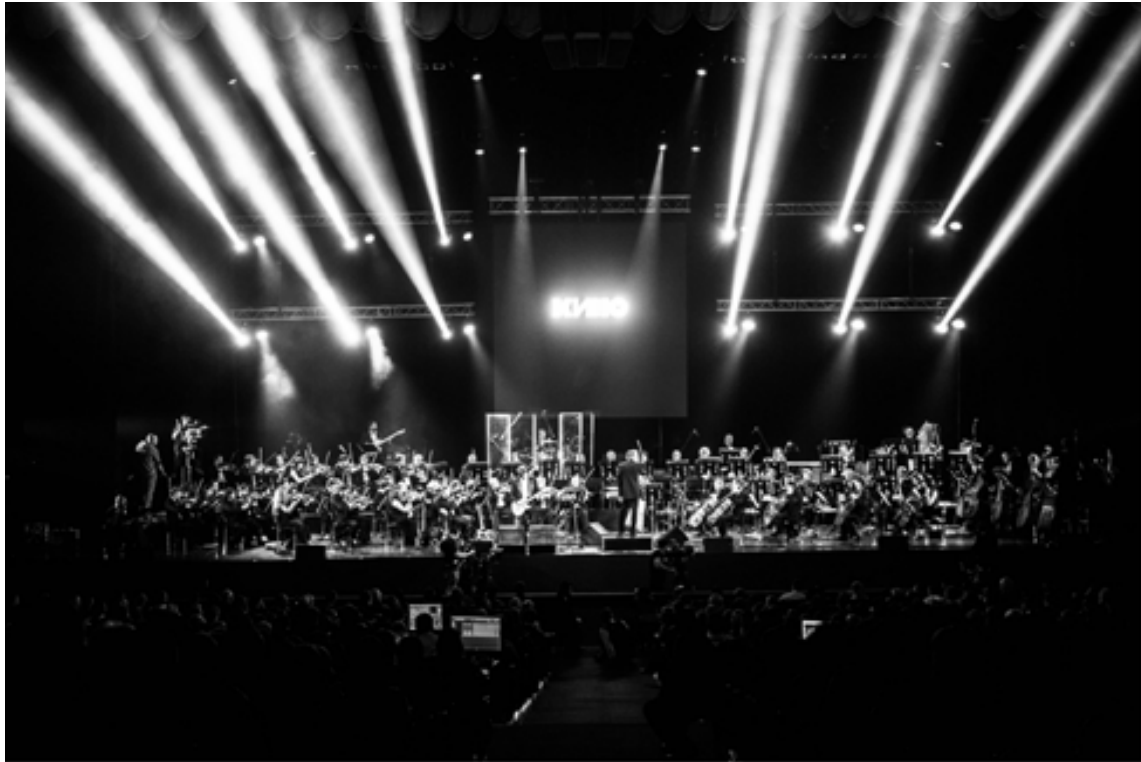
Симфоническое КИНО. Фотограф Дмитрий Строщ, 2015