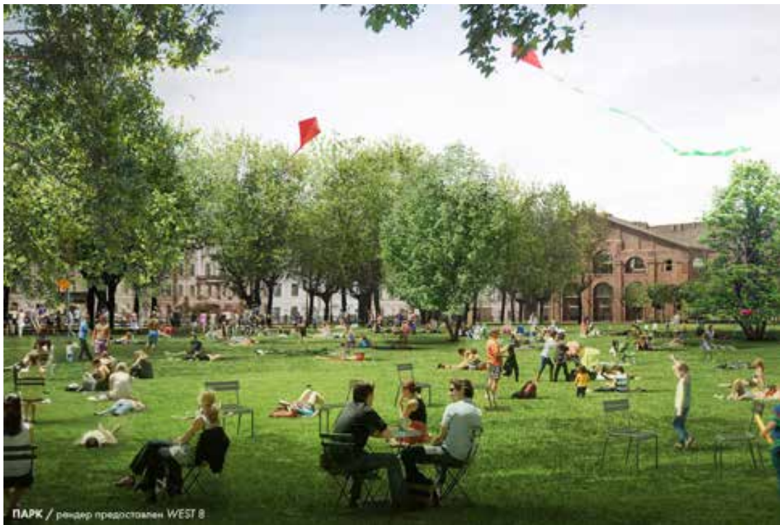
ПАРК / рендер предоставлен WEST 8