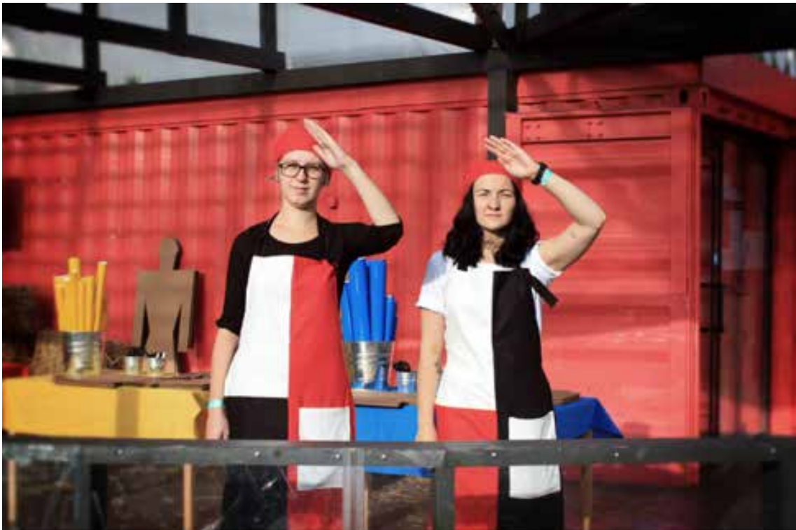
Лето в Новой Голландии. Фото Егор Роголёв, 2013