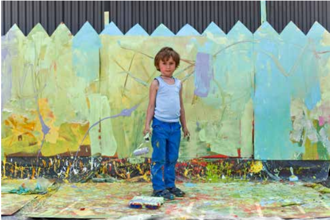
День замечательных детей. 2013